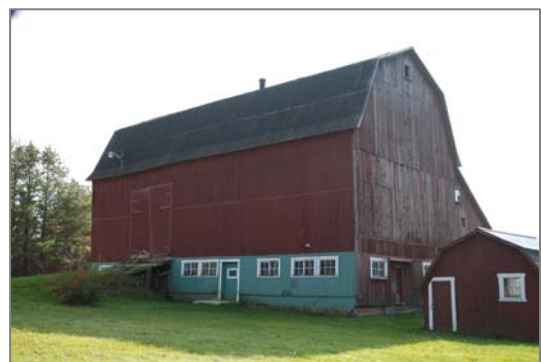
La peinture appliquée sur le revêtement de bois de cette grange-étable lui assure une meilleure conservation.