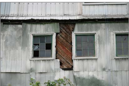
Un revêtement de planches posées en diagonale se trouve sous la tôle profilée de cette grange-étable.