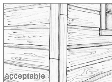
La planche cornière et le chambranle offrent une meilleure finition aux revêtements de bois posés à l'horizontale.