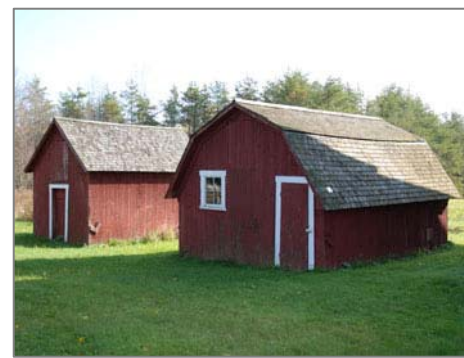
Bâtiments agricoles dont la couverture est en bardeau de cèdre

Les blocs de béton, les tuiles d'amiante-ciment et la tôle galvanisée sont d'autres types de revêtement rencontrés dans les paysages agricoles de la MRC de Coaticook. Apparus plus récemment, ces matériaux industrialisés peuvent néanmoins être conservés si ils sont d'origine. Dans le cas de bâtiments anciens, il convient toutefois de privilégier le bois pour les revêtements.